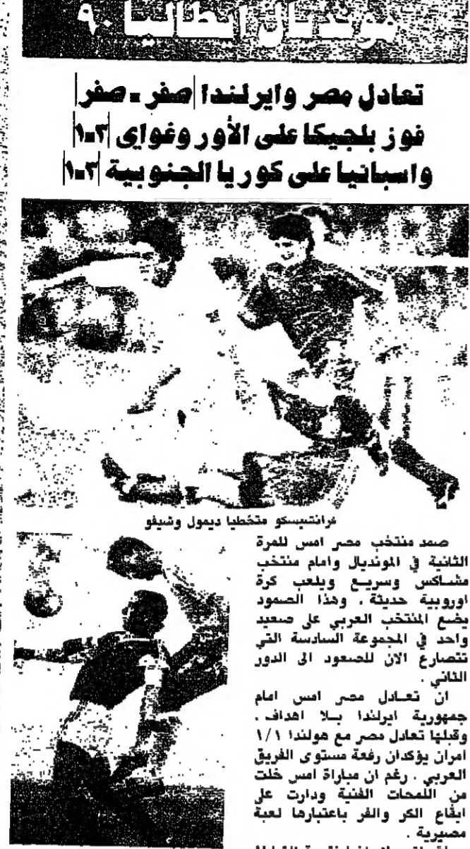
ماتيو ماتيو مطبخا ديومول وشيفو

صعد منتخب مصر امس للمرة الثانية في المونديال وامام منتخب هولندا وسريع ويغيب كرة اوروبية حديثة، وهذا الصعود يضع المنتخب العربي على صعيد واحد في المجموعة السادسة التي تتصارع الآن للصعود الى الدور الثاني. ان تعادل مصر امس امام جمهورية ايرلندا بلا اهداف، وقيلبا تعادل مصر مع هولندا ١/١ امراين يؤكدا ان رغبة مستوى الفريق العربي، رغم ان مباراة امس خلت من الملحمات الفنية ودارت على أبطاع الكر والفرا باعتبارها لعبة مصيرية. لاقت ايرلندا نتيجة الشاطئ في الآراء، ان تطويق المنطقة الحساسة للحرس المينر احمدم شوير بعض الوقت ولكن صوية افضل كل الجزمات وصدر كرة صوية منقلا مرمام من هدف شبه محقق. يبقى للتذكير ان مهاجم ايرلندا المعروف جون البريدج كان احد قبل المباراة الا فريضة اثنى تمام الثقة من انتزاع نقطتين للصعود الى الدور الثاني، فخاب ظنه. علما ان مدربه، التزعه، هو بالذات في